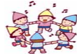
コミュニケーション