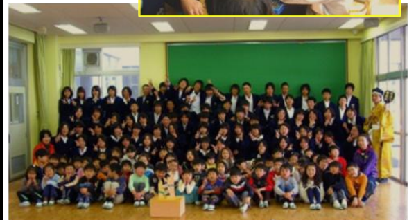
小1と中1の異学年交流「紙相撲美加の台場所」