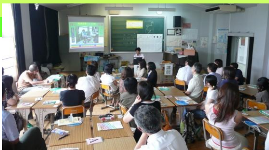
市内小中教員対象に「小中連携」研修会