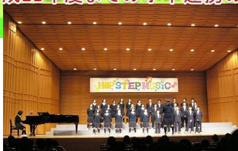
小6を招待して合唱コンクール(ラフリー大ホール)