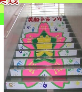
小と中の校章をモチーフにした「階段アート」