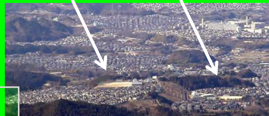
金剛山から見た美加の台